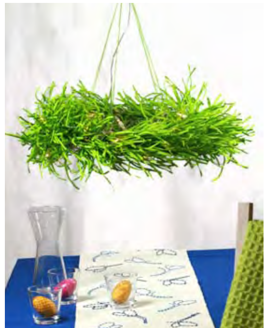
Daalia-tyyny Jemma-kori Hohde-pöytäkoru Tähti-valokori