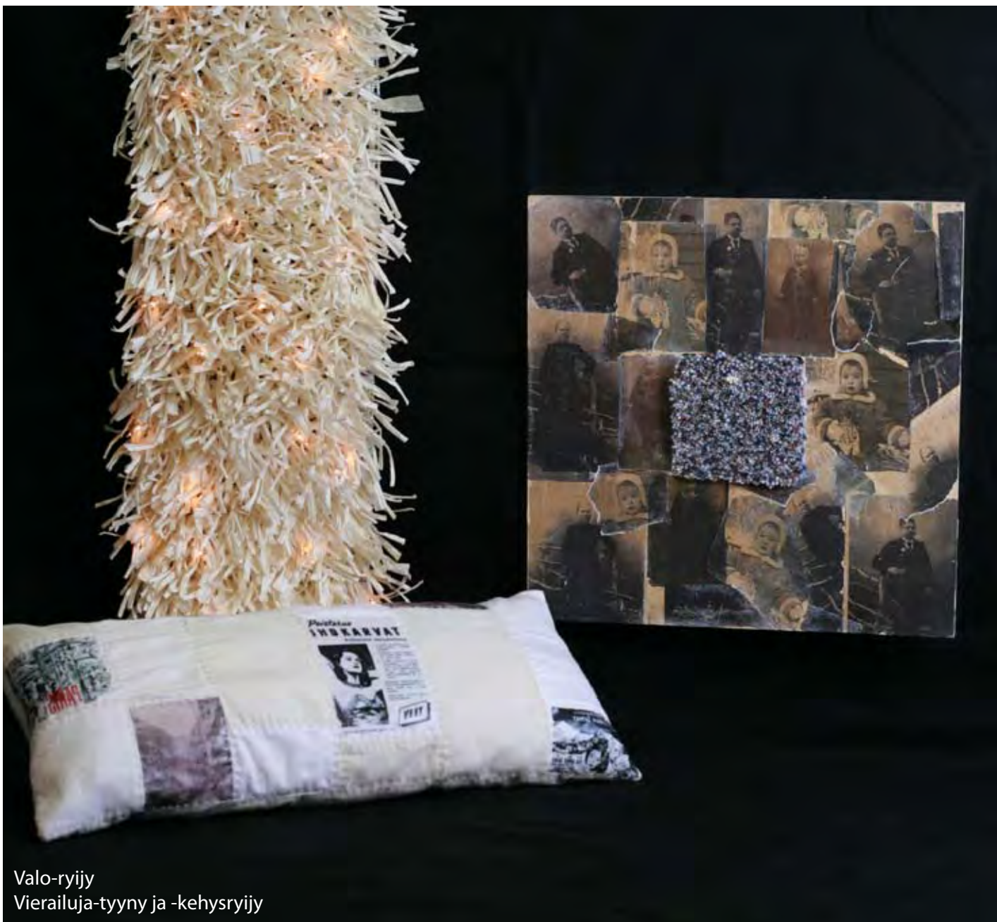
Valo-ryijy Vierailuja-tyyny ja -kehysryijy