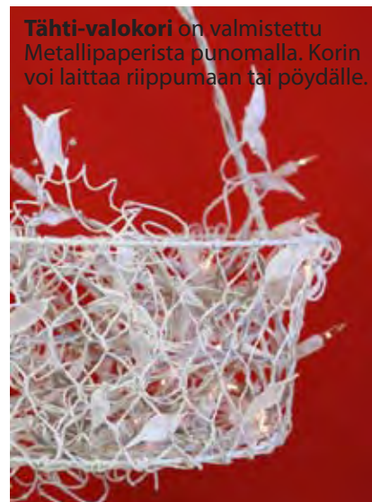
Tähti-valokori on valmistettu Metallipaperista punomalla. Korin voi laittaa riippumaan tai pöydälle.