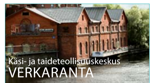
Käsi- ja taideteollisuuskeskus VERKARANTA

* Kurssi ja työpaja ilmoittautumiset ja peruutukset viimeistään viikkoa ennen.