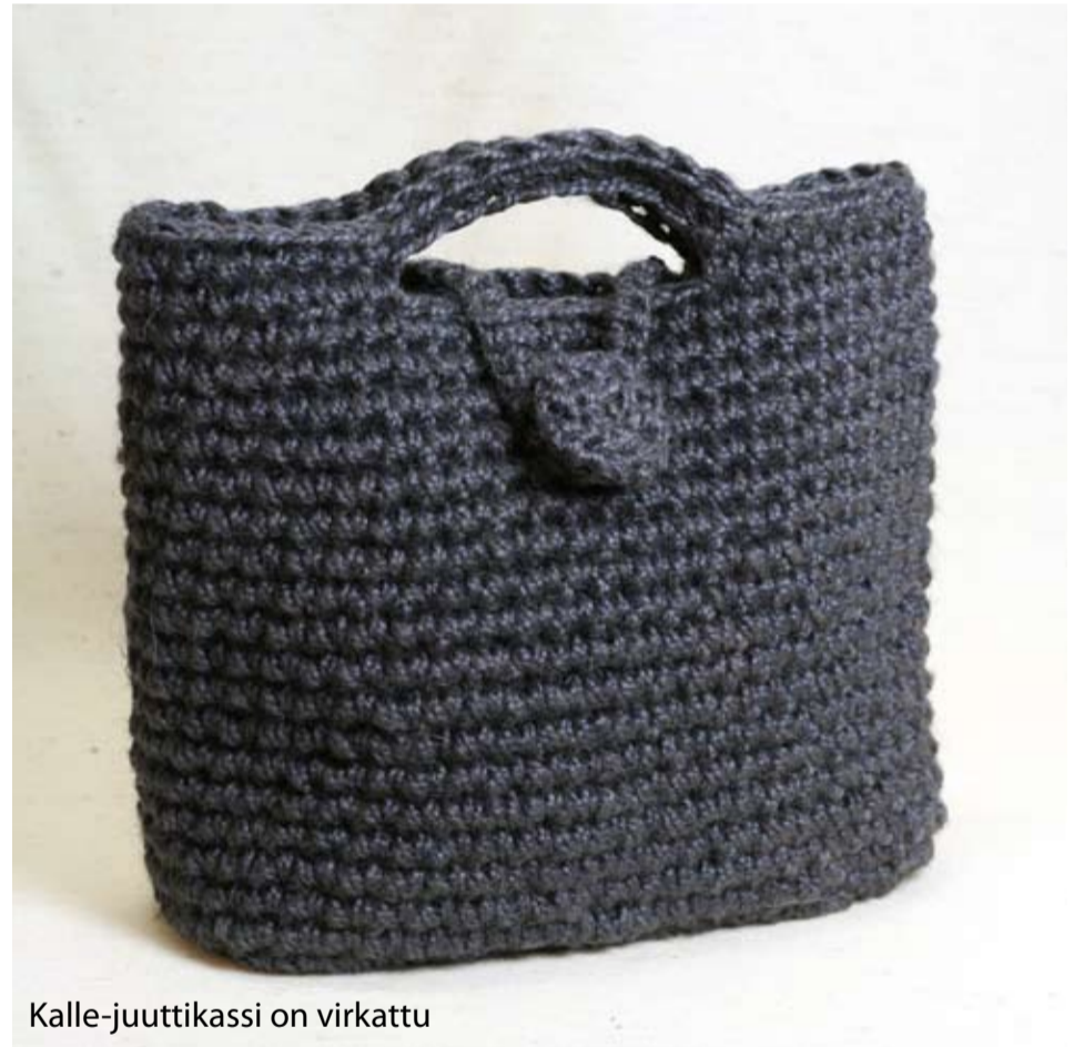
Kalle-juuttikassi on virkattu