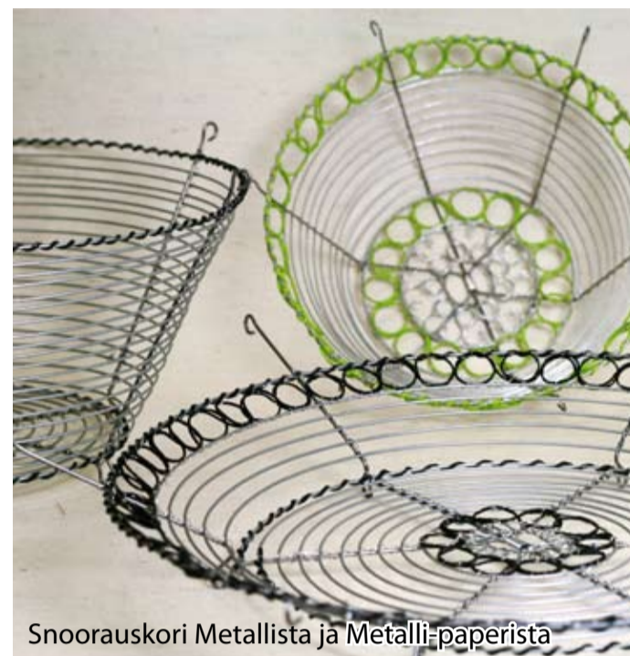
Snoorauskori Metallista ja Metallipaperista