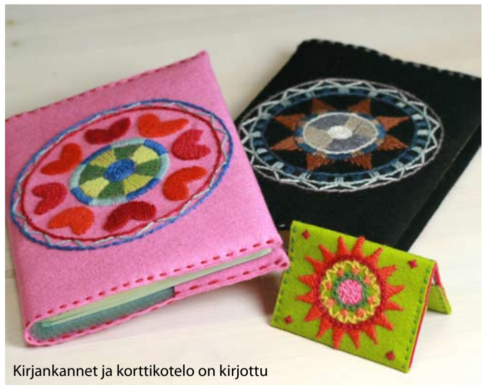
Kirjankannet ja korttikotelo on kirjottu