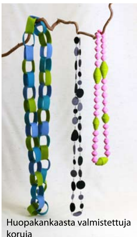
Huopakankaasta valmistettuja koruja