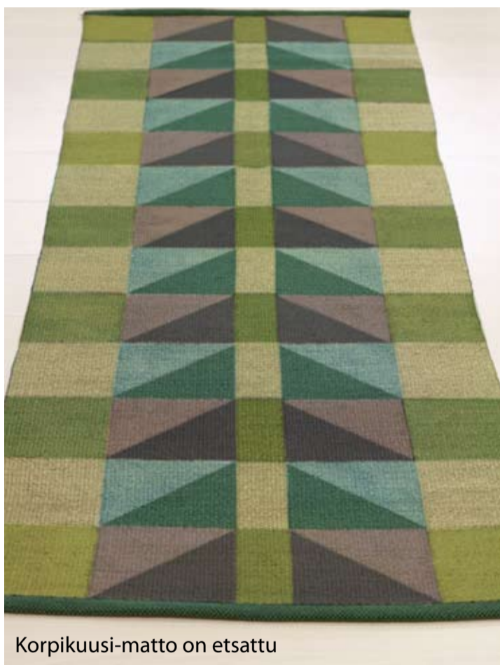
Korpikuusi-matto on etsattu