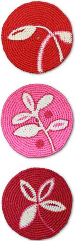
Varpu-seinätekstiilit on etsattu virkkaamisen jälkeen.