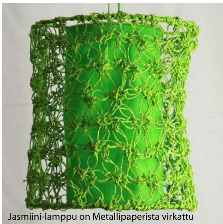
Jasmiini-lamppu on Metallipaperista virkattu

TULE TEKEMÄÄN MALLISTON TUOTTEITA KÄSITYÖKESKUKSIIMME