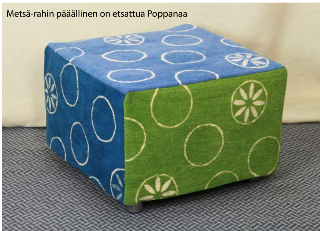
Metsä-rahin päällinen on etsattua Poppanaa