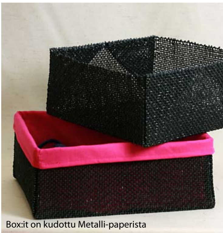
Box:it on kudottu Metallipaperista