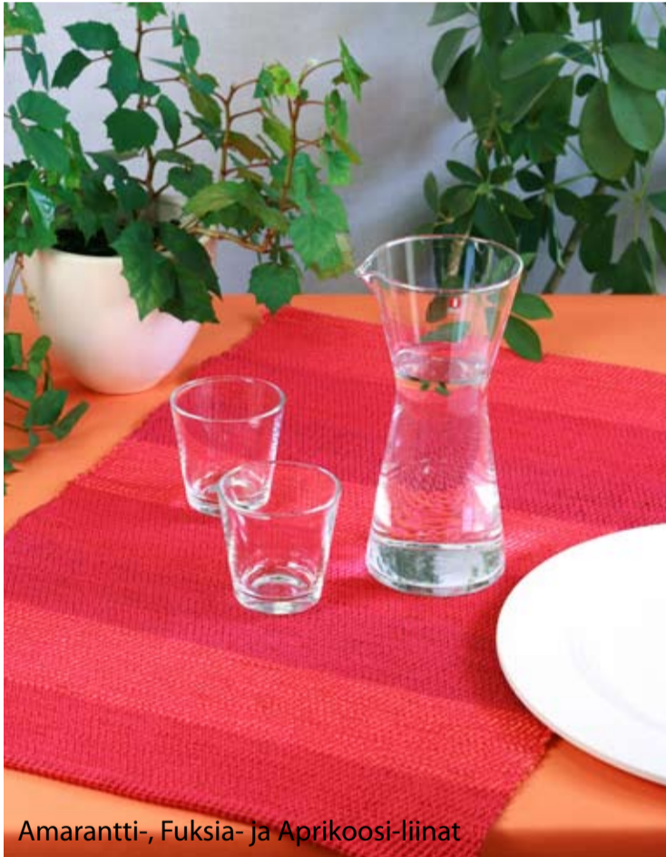
Amarantti-, Fuksia- ja Aprikoosi-liinat