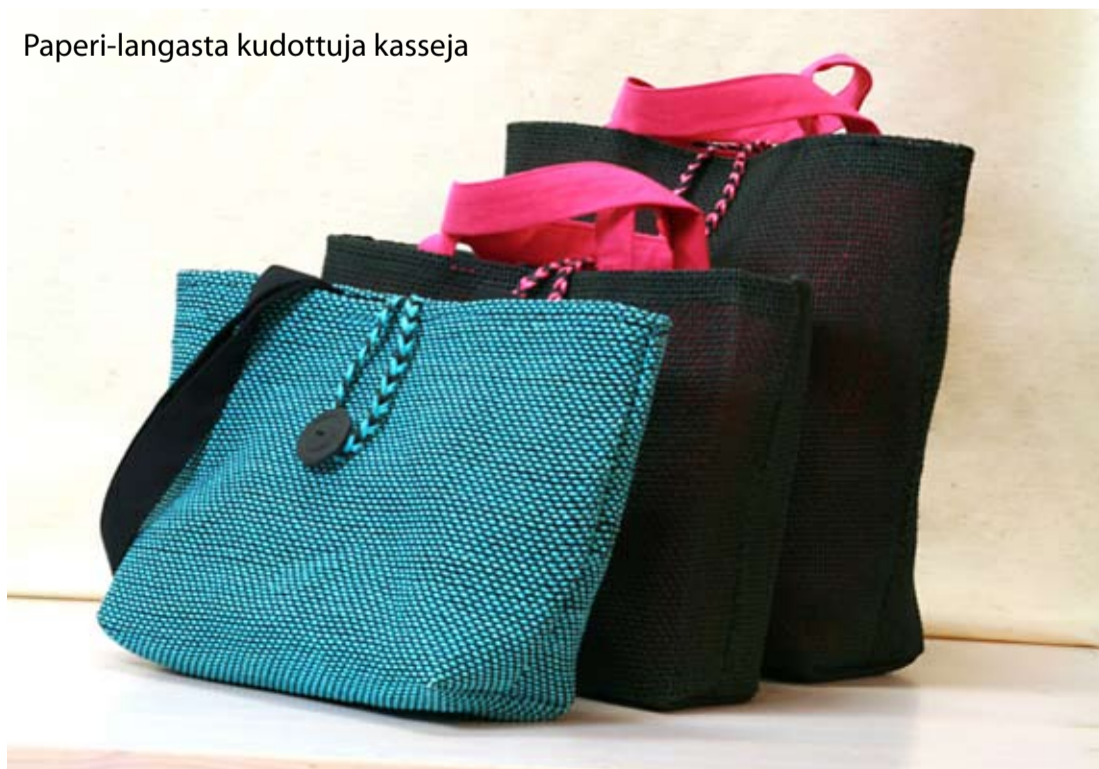
Paperi-langasta kudottuja kasseja